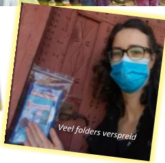
Veel folders verspreid

'We voelen ons zo gezegend dat we dit kinderwerk mogen doen. Groot is onze dank; aan God en iedereen die het kinderevangelisatiewerk in 2020 mogelijk maakte!'