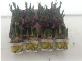
1 hele tray

Uw bestelling kan ook per mail worden doorgegeven aan: hometeamsperanta@hotmail.com