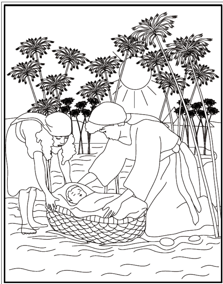
Bron: evangelisatiewerk GG, 2014

Oplossingen bij voorkeur inleveren via email: puzzel@hhgouddorp.nl .